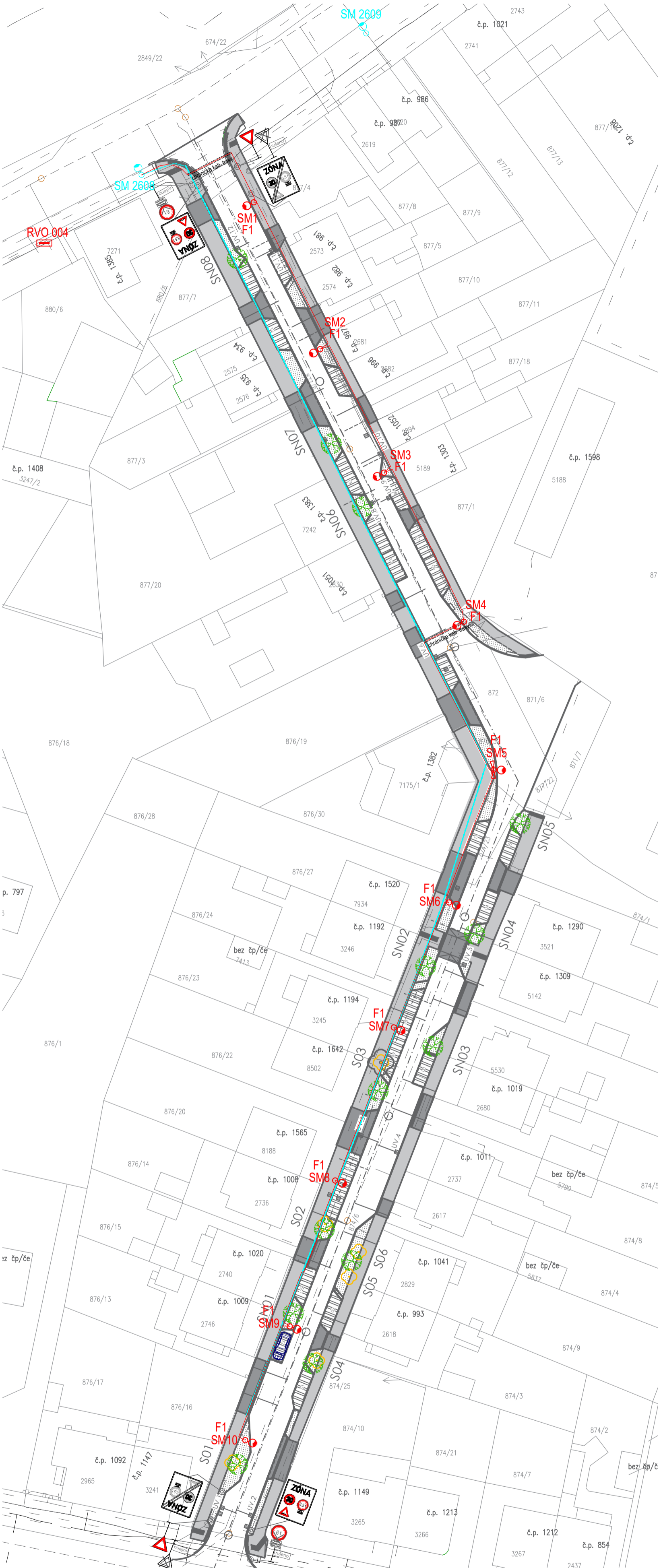
STANDARD ŘEZŮ V JEDNOTLIVÝCH ÚSECÍCH KABELOVÉ TRASY VE MĚSTĚ KOLÍN